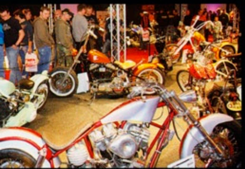
BIGTWIN BIKESHOW 2007