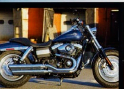
DYNA FAT BOB FXDF